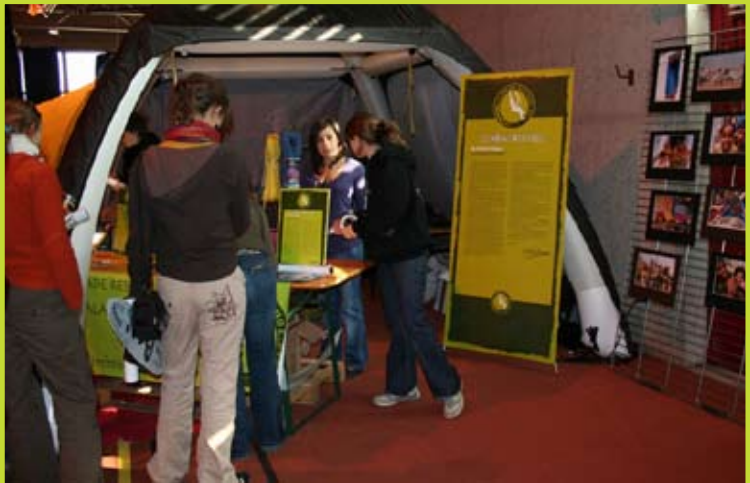
Stand Coupe du monde de Valence