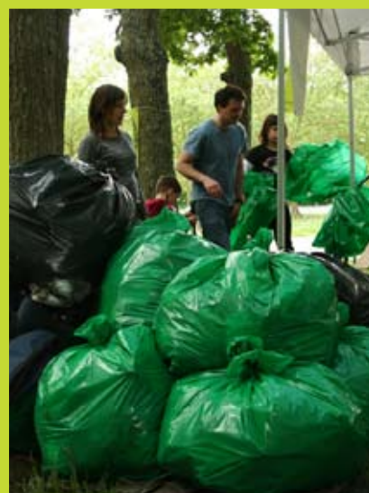
Monticule de déchets collectés lors du clean up day de Fontainebleau

Ainsi que de nombreux clean up day organisés par des adhérents dans la France entière.