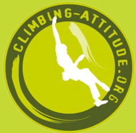
Logo Climbing Attitude

Les problèmes les plus souvent rencontrés sont des désagréments pour les riverains et les propriétaires, liés au non-respect des parkings ou des chemins, voir même à la pollution laissée sur place par la pratique de l'escalade, il est temps que nous nous prenions en mains sans attendre que nos sites ne deviennent des sites interdits, des sites poubelles, des sites payants comme on commence à le voir dans certains pays !