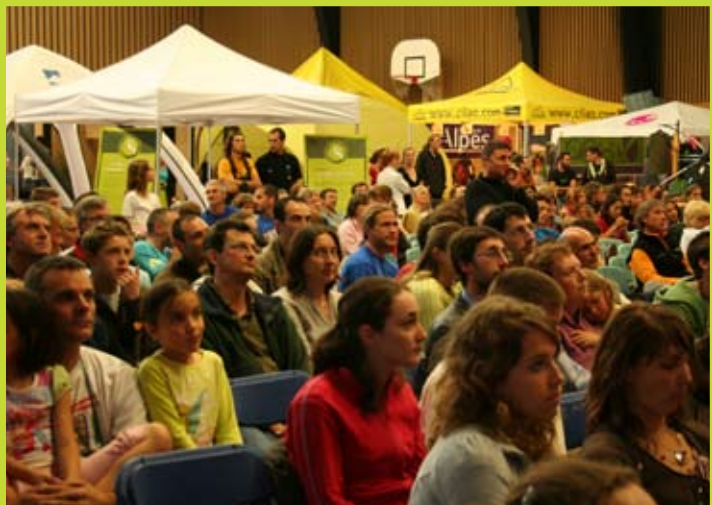
Stand Championnat de France espoir Voiron

Juin 2008 : festival outdoor « Roc Trip Millau »