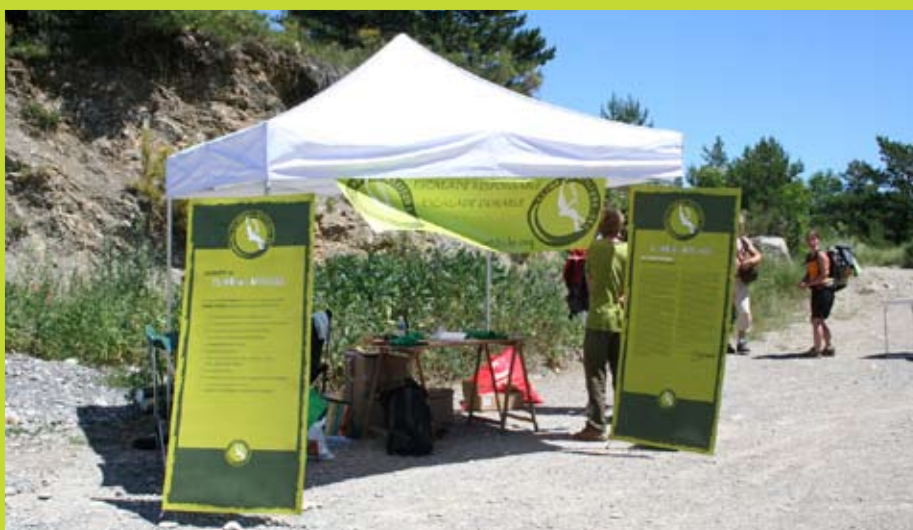
Stand Clean up day Céuse