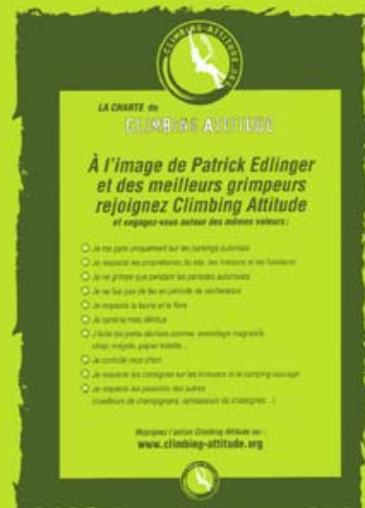
Charte Climbing Attitude dans le nouveau topo du Ventoux