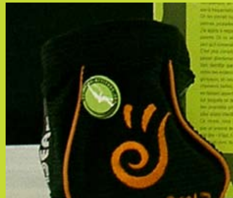
Badge adhérent sur un sac à magnésie