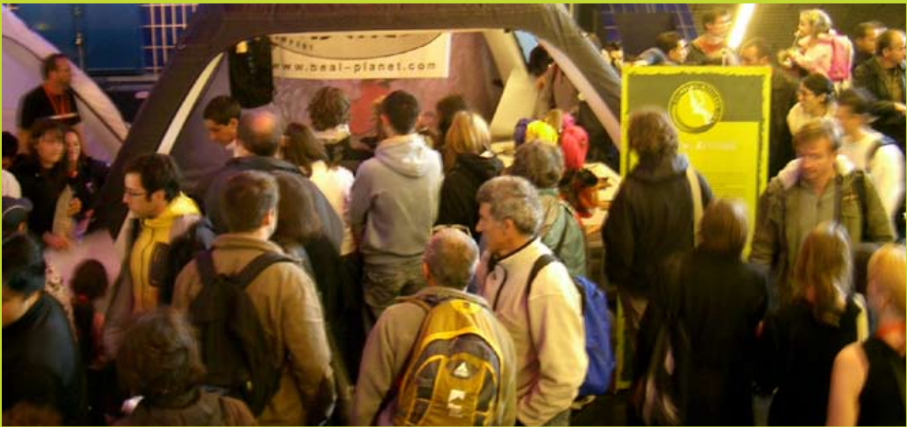
Stand Championnat d'Europe de Bercy

Projet de panneau informatif implanté sur le parking de Céuse