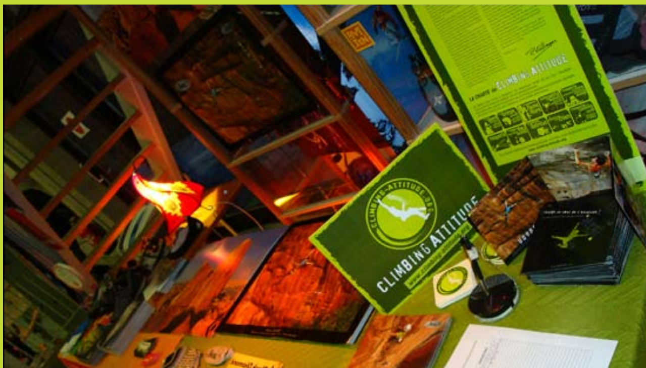
Stand sur le Club Tour 2008 d'Alex Chabot

Rubrique contact sur www.climbing-attitude.org